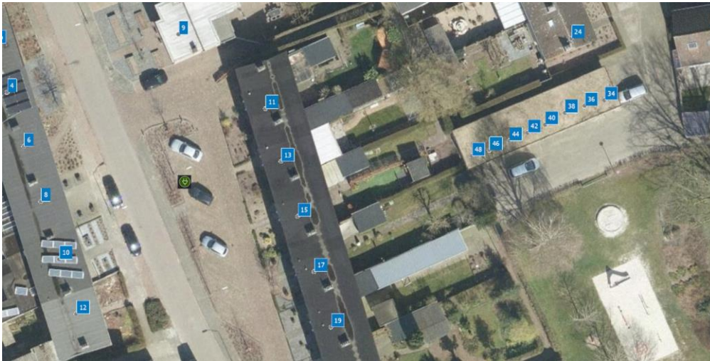
Figuur: voorkeurslocatie aan de Pastoor J. Groenenstraat 13 Nistelrode