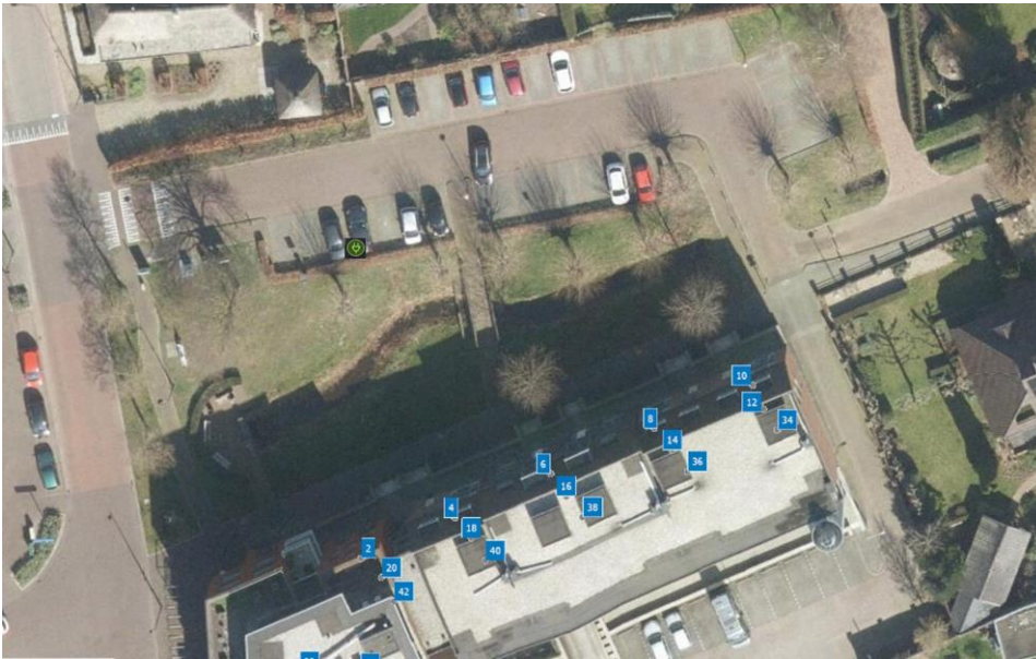
Figuur: voorkeurslocatie De Beekgraaf ter hoogte van 22 Nistelrode